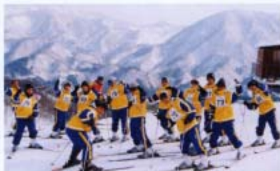
修学旅行・スキー実習