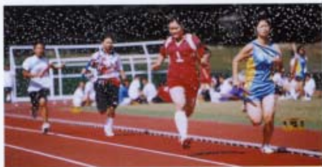
体育祭・クラブ対抗リレー

水泳 柔道 陸上競技 剣道 野球 卓球 サッカー バスケットボール ラグビー バレーボール 硬式テニス バドミントン ソフトテニス チアリーダー