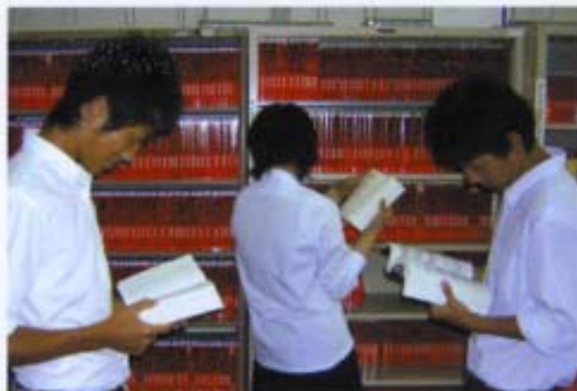
[進路指導室の豊富な資料を活用する]