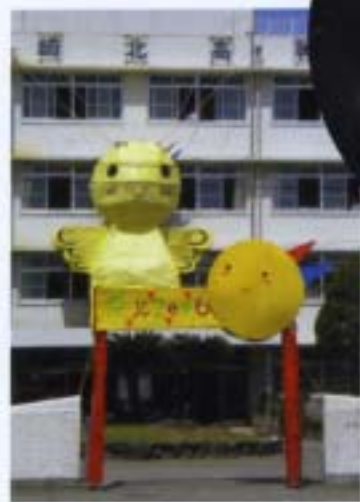
文化祭大人形とアーチ