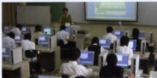
コンピュータを使った授業風景