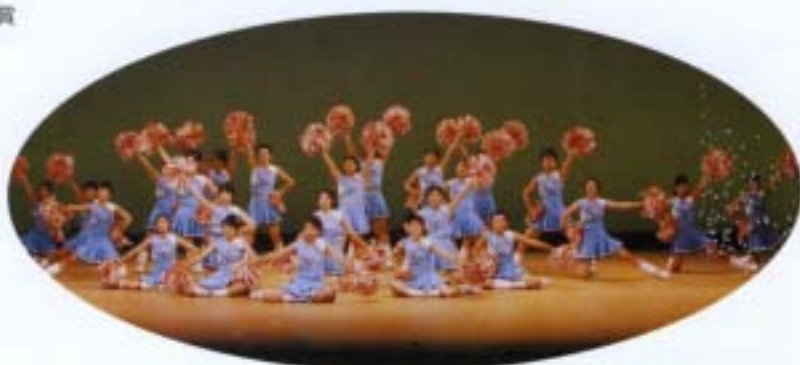
北高祭・アルカイック公演

水泳部(水球) 近畿総体準優勝・全国総体(ベスト8) 61回のにじぎく兵庫国体(5位) 全国Jr.オリンピック近畿予選(準優勝) 全国Jr.オリンピック出場 陸上競技部 近畿総体(八種競技3位) (走幅跳び・砲丸投)出場 全国総体(八種競技)出場 ソフトテニス部 近畿総体(男子団体ベスト16) 柔道部 近畿高校新人大会(男子団体出場) 箏曲部 近畿総合文化祭演奏披露