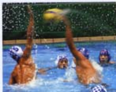
水泳部の のじぎく 兵庫国体