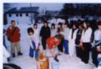
修学旅行・餅つき