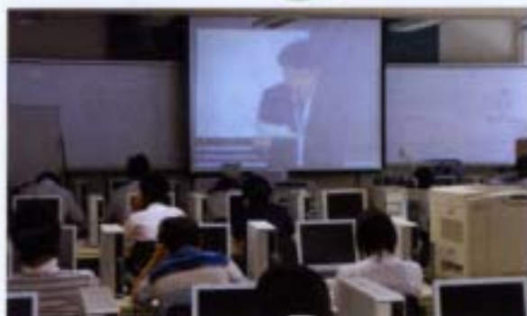
高大連携TV会議授業