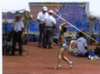
陸上競技部 '06 全国高校総体 (大阪)