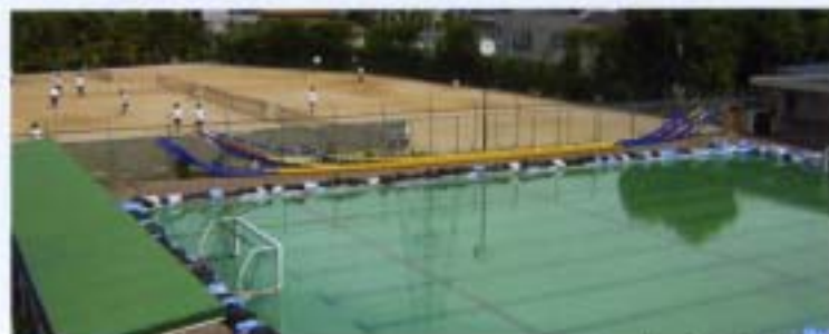
プール・テニスコート