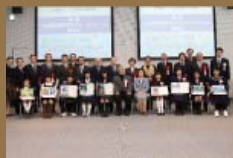
昨年の表彰式の様子