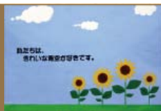
第1回全国環境教育ポスターコンクール 最優秀賞作品