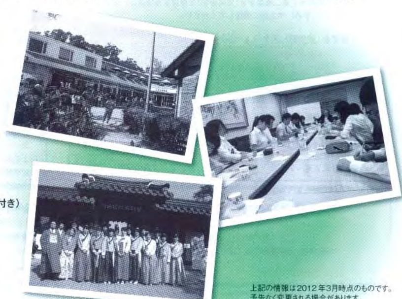
上記の情報は2012年3月時点のものです。予告なく変更される場合があります。