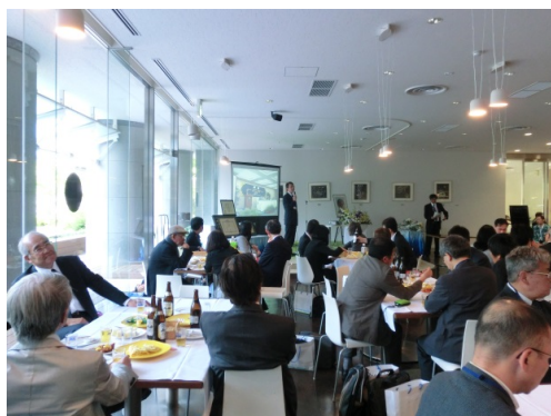
<お別れの会の様子>