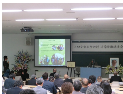
<アジザン先生によるご講演>